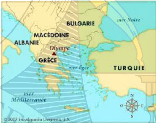
Doc.1 : une carte représentant la Grèce

La plupart d'entre eux vivaient sur le mont Olympe. C'est une montagne qui aujourd'hui encore existe au nord de la Grèce.