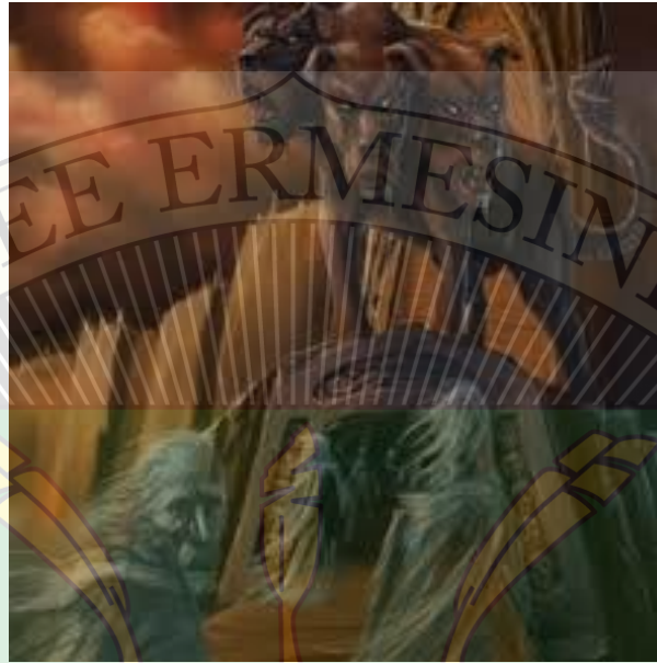
Doc 8 : Cerbère

Les Enfers étaient très sombres et absolument pas marrant. Dans les Enfers il y avait aussi le Gardien. C'est à lui qu'incombe la charge d'amener les morts de l'autre côté du lac et de les garder aux Enfers. Beaucoup de gens ne l'aimaient pas parce qu'ils croyaient qu'il était méchant, mais en fait il n'était pas méchant du tout. La route vers les Enfers était pareil pour tous, les bons comme les mauvais, ils n'avaient pas d'emplacements séparés, tout de même parfois des gens sont mis à l'écart pour être punis. Hadès était marié à Perséphone. Il l'a obligée à l'épouser en l'enlevant tandis qu'elle était en train de cueillir des fleurs avec ses amies. De tristesse sa mère refusait de travailler jusqu'à ce qu'elle puisse revoir sa fille bien aimée Perséphone. Zeus disa à Hadès de rendre Perséphone à sa mère Déméter sinon le monde allait souffrir de famine. Avant de la laisser partir il lui donna une grenade, la nourriture spéciale des morts, mais malheureusement Perséphone mangea un grain avant de partir des Enfers. Comme elle en avait mangé alors quelle était encore aux Enfers elle fut condamné à y passer quatre à six mois tous les ans. Il est interdit