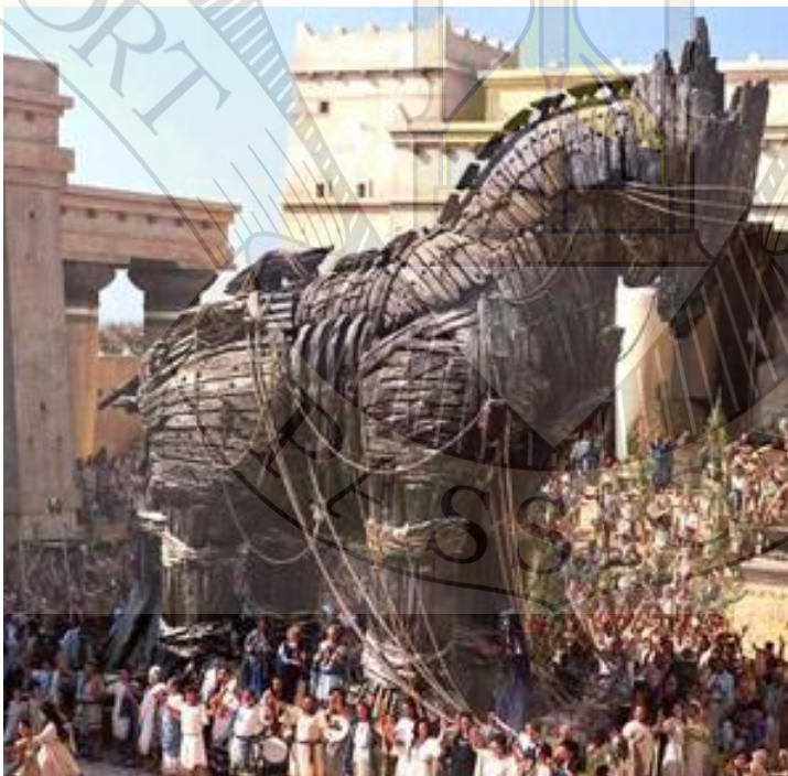
Doc 5 : le cheval de Troie

murailles de Troie. Son plan consistait à cacher leurs meilleurs guerriers dans un énorme cheval en bois et d'attendre que les troyens prennent le cheval chez eux derrière les murailles et puis de tout détruire. Son plan a failli marcher mais soudain un prêtre nommé Laocoon a prétendu que ce cheval énorme était un piège mais au premier coup d'œil le roi de Troie croyait que c'était un cadeau des dieux mais le prêtre n'a pas arrêté d'essayer de les convaincre alors Poséidon le dieu suprême des océans s'en est mêlé. Il a tué le prêtre avec son serpent des eaux énorme et on n'a plus revu le prêtre. Donc les troyens ont pris le cheval avec eux dans leur royaume et pendant la nuit les grecs les ont tous tués. Ulysse qui était très fier de lui a prétendu que c'était grâce à lui que les grecs ont gagné et que les hommes n'ont pas besoin des dieux, mais malheureusement Poséidon a tout entendu et s'est mis très en colère et a maudit Ulysse et lui a enlevé ainsi la possibilité à Ulysse de revoir sa famille après environ presque dix ans de guerre.