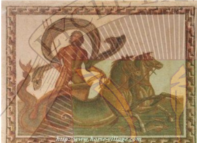
Doc 6 : Les hippocampes de Poséidon

Dieu des tremblements de terre et dieu des eaux, Poséidon réside au fond des eaux. Parfois, il sort de son palais sur son char attelé d'hippocampes aux couleurs d'algues et d'écume.