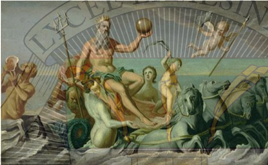
Doc 4 : Poséidon sur son char

Poséidon est le deuxième fils de Cronos et d'Héra il a été élevé par les Telchines. Les Telchines sont des divinités inférieures qui sont très fortes pour les aptitudes créatrices et techniques. Il est très célèbre pour ses amours fous avec les immortels et les créatures comme Méduse.