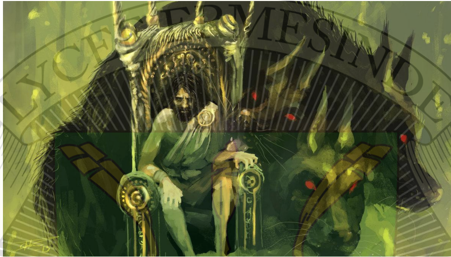
Doc 7 Hades

Hadès est le troisième fils de Cronos et de Rhéa. Hadès acquit possession du monde inférieur les Enfers. Il est l'époux de Perséphone, qu'il enleva et l'emmena avec lui dans les Enfers. Hadès est un dieu redouté par les grecs, on raconte qu'il est impitoyable, qu'il est assis sur un trône au fond des Enfers dans sa main un spectre avec lequel il gouverne les morts. Il porte sur sa tête un casque qui rend invisible, les cyclopes lui en firent cadeau. Lui-même prête parfois son casque aux héros à qui il fait confiance.